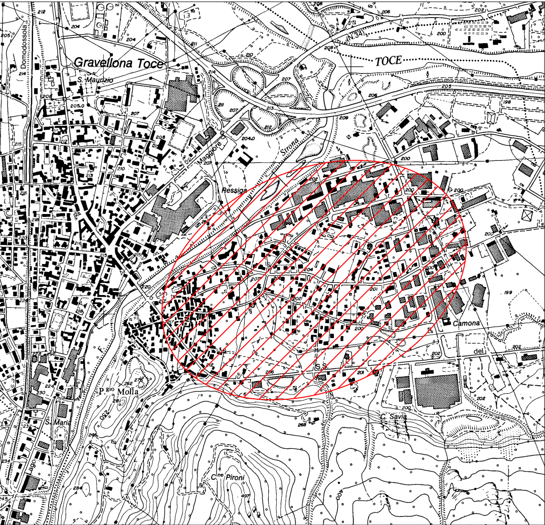
CTR - 073060 Scala 1:10.000