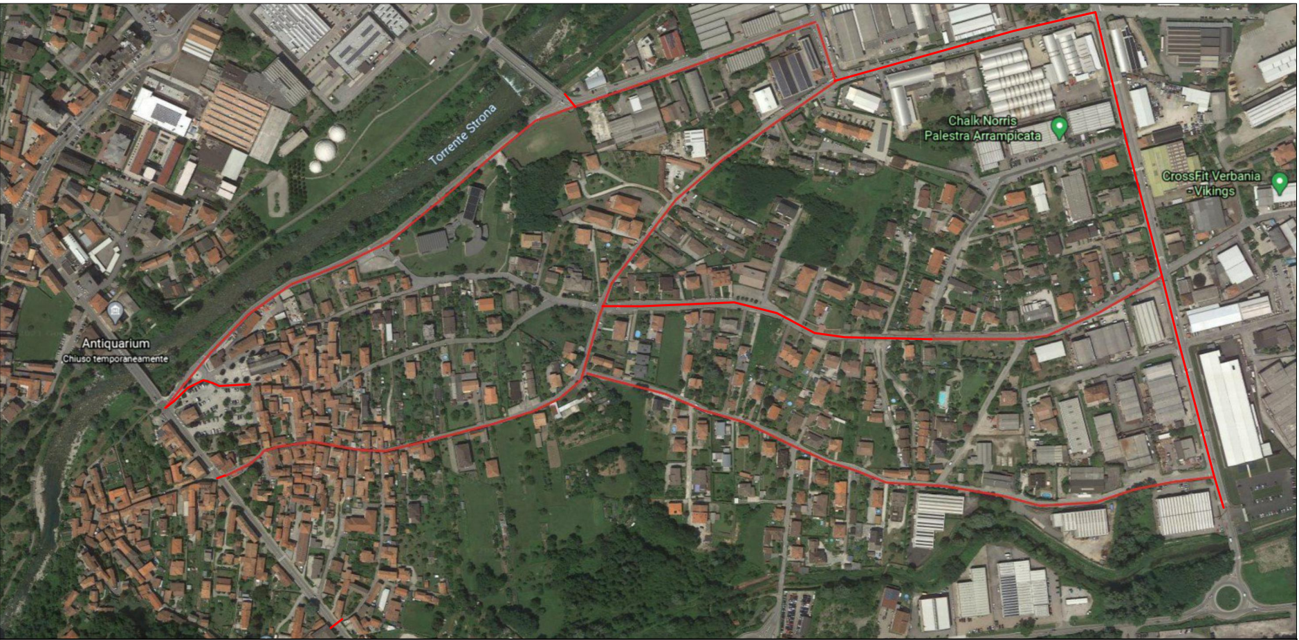
Ortofoto Fuori Scala