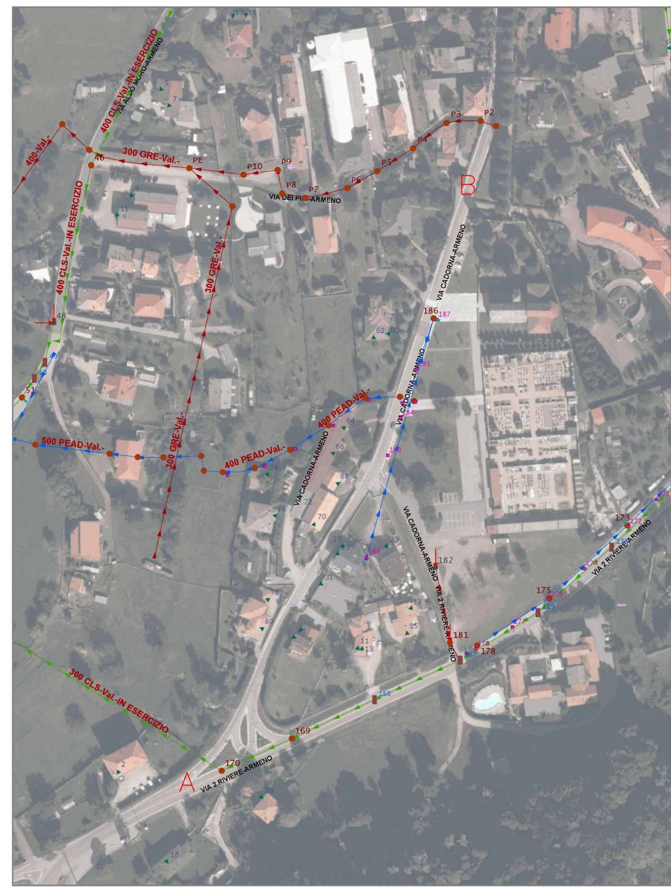
PLANIMETRIA RETI FOGNARIE ESISTENTI - Scala 1:200