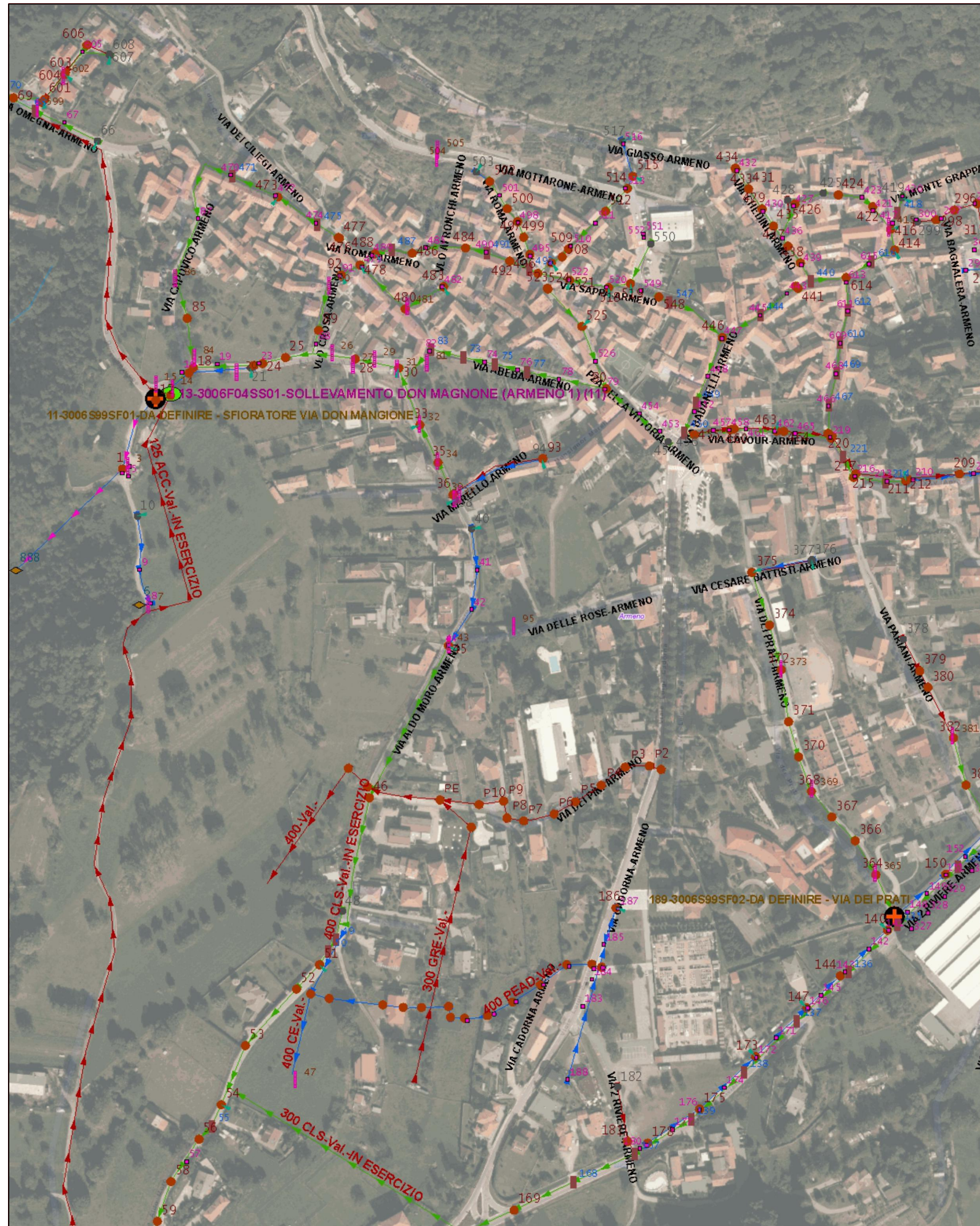
Reti Fognarie Esistenti