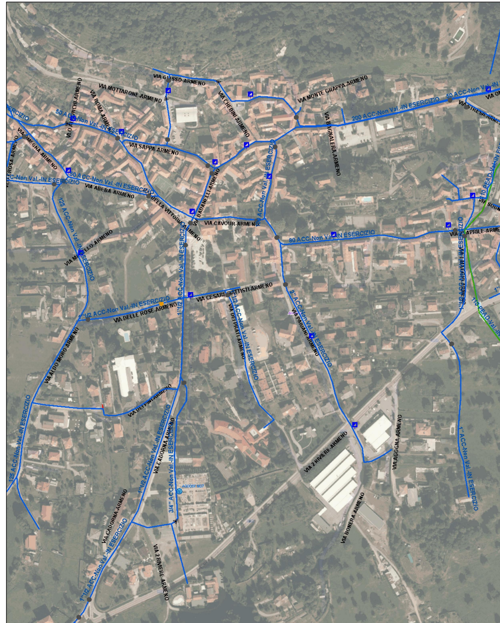
Reti Idriche Esistenti